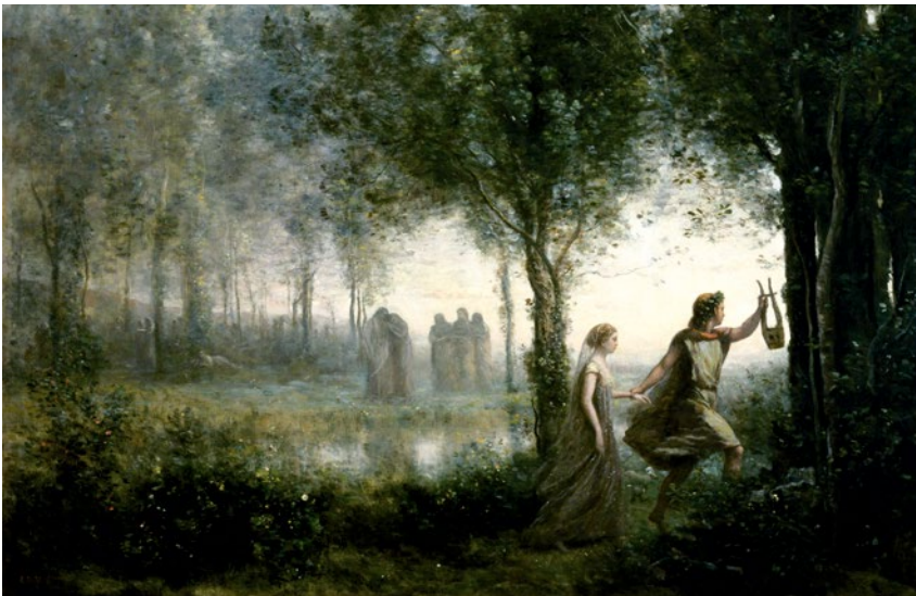
Jean-Baptiste Corot, Orphée ramenant Eurydice des Enfers

Orphée est le musicien et le poète le plus connu et le plus talentueux de la mythologie grecque. Le dieu Apollon, dieu de la Musique et des Arts, lui donne à sa naissance une lyre, sorte de petite harpe. As-tu déjà vu une harpe ? Avec son instrument, Orphée va très vite devenir célèbre tant il en joue divinement bien ! On dit même qu'il est capable d'attendrir avec sa lyre les bêtes les plus féroces, de faire pleurer les hommes et d'attendrir les dieux. D'ailleurs, ces talents musicaux vont lui être très utiles, tu vas voir ! Il rencontre Eurydice, une nymphe très timide et belle telle sa musique, toujours selon le mythe ! Ils s'aiment passionnément et vivent heureux quelques temps. Mais le jour du mariage, Eurydice pose malencontreusement son pied sur un serpent venimeux qui la mord à la cheville et elle meurt. Comme tous les mortels, elle va aux Enfers. Orphée fou amoureux d'elle, va la rechercher et parvient, grâce à sa musique, à faire fléchir Cérèbe, le gardien des Enfers. Celui-ci le laisse repartir avec sa bien-aimée à la condition qu'elle le suive et qu'il ne se retourne ni