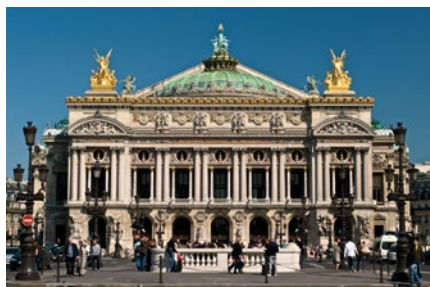
Opéra de Paris