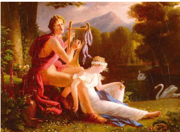
Louis Ducis, Orphée et Eurydice