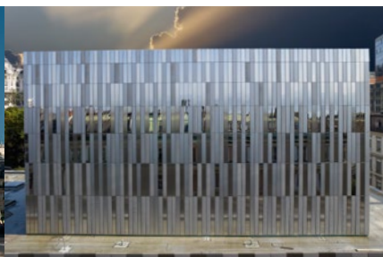
Opéra de Lausanne