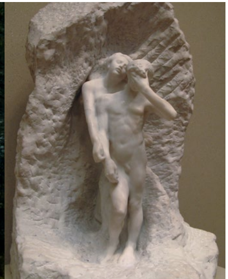
Rodin, Orphée et Eurydice