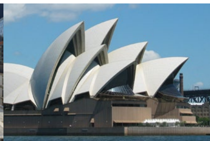
Opéra de Sydney